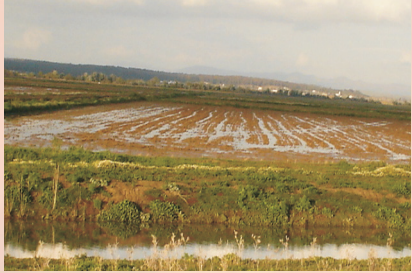
Périmètre irrigué (rizières)