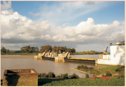
Barrage de garde