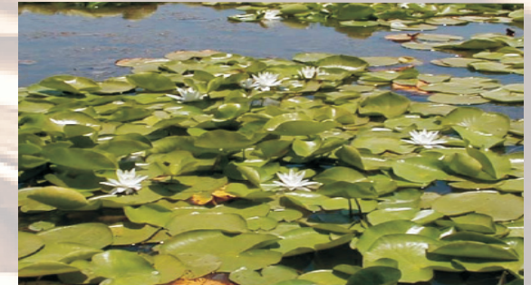
Merjas envahies de végétation (Emergents persistants et lits aquatiques)