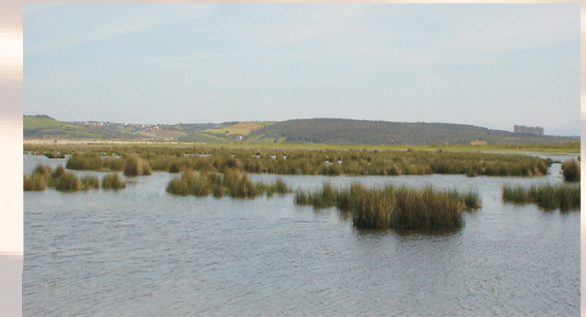
Systèmes palustre et lacustre