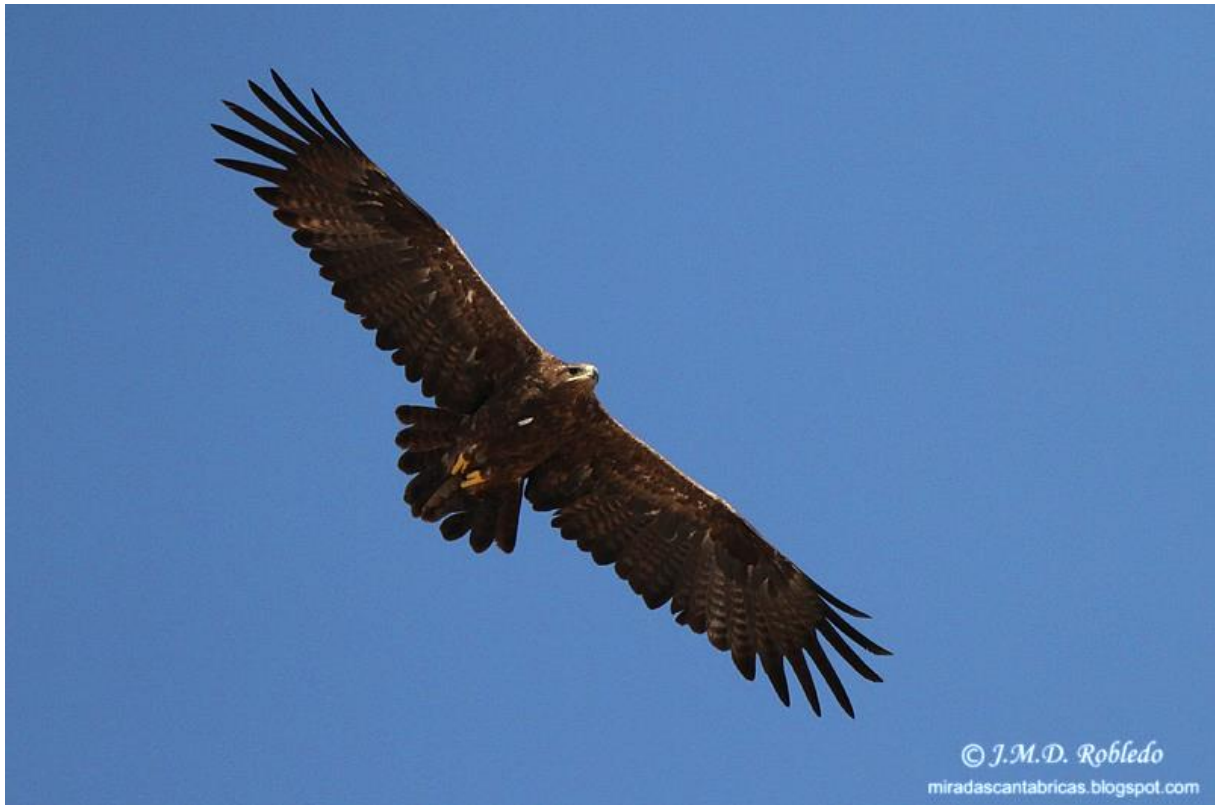
Photo 1. Aigle des steppes adulte. Oman, novembre 2012