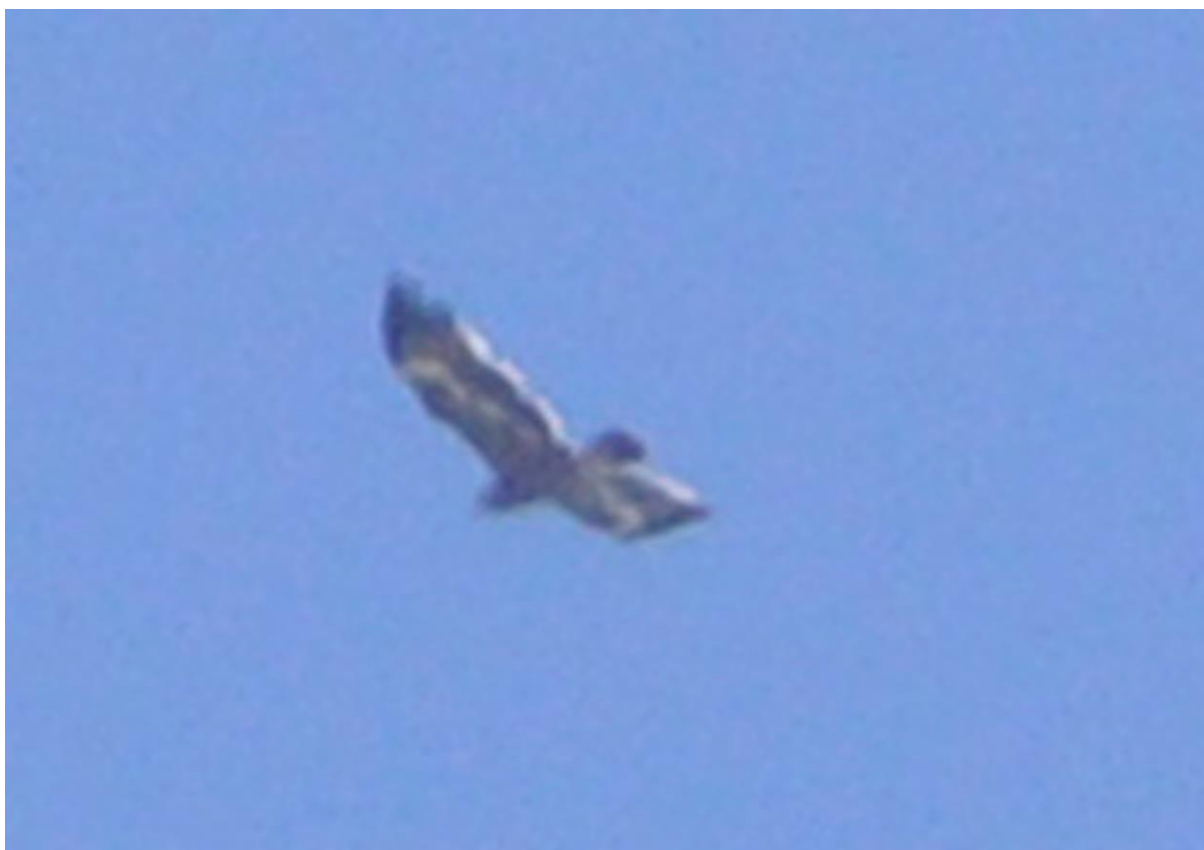
Photos 1 et 2. Aigle des steppes Aquila nipalensis immature. Jbel Moussa, Maroc, 18 mai 2017