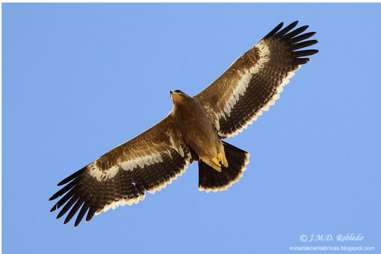
Photo 2. Aigle des steppes juvénile, première année calendaire. Oman, novembre 2012